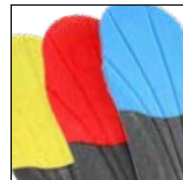
Vario Wide Fit System